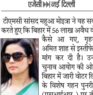
गृह मंत्रालय क्या कर रहा था?

टीएमसी सांसद महुआ मोड़ना ने यह सवाल करते हुए कि बिहार में 56 लाख अवैध वोट कैसे आ गए, गृहमंत्री अमित शाह से इस्तीफे की मांग कर दी है। उन्होंने चुनाव आयोग की ओर से बिहार में जारी वोट लिस्ट के विशेष गहन पुनरीक्षण (एसआईआर) पर तीखा हमला बोला है। मोड़ना ने कहा है कि सीमा-संबंधी मसला केंद्रीय गृह मंत्रालय के अधीन आता है, इसलिए गृहमंत्री को इस्तीफा दे देना चाहिए। एसआईआर के मुद्दे पर संसद का मानसून सत्र नहीं चल पा रहा है।