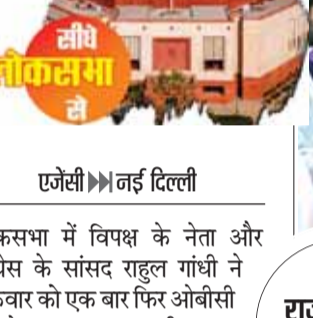
एजेसी ►► नई दिल्ली

मुझे ओबीसी वर्ग की जिस तरह से रक्षा करनी थी, मैंने नहीं की