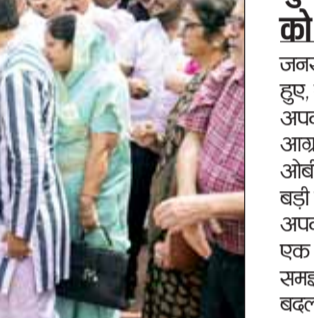
तब जातिगत गणना करवा देते तो आज जैसी नहीं होती

राहुल ने कहा कि ओबीसी की मुश्किलें छुपी रहती हैं। मुझे अगर आपके मुद्दों और परेशानियों के बारे में उस वक्त पता होता तो मैं उसी वक्त जातिगत जनगणना करवा देता। वो मेरी गलती है, जिसे मैं ठीक करने जा रहा हूँ। ये एक तरह से अच्छा ही हुआ, क्योंकि अगर उस समय मैंने जातिगत गणना करवा दी होती तो वो आज जैसी नहीं होती।