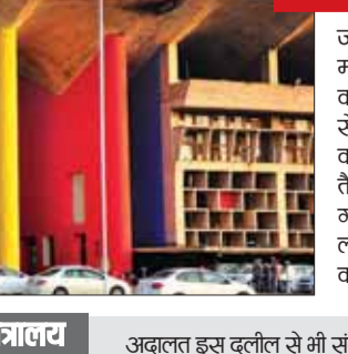
रक्षा मंत्रालय उसे उदारीकृत पेंशन दे