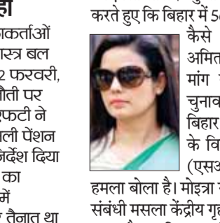
गृह मंत्रालय क्या कर रहा था?

टीएमसी सांसद महुआ मोड़ना ने यह सवाल करते हुए कि बिहार में 56 लाख अवैध वोट कैसे आ गए, गृहमंत्री अमित शाह से इस्तीफे की मांग कर दी है। उन्होंने चुनाव आयोग की ओर से बिहार में जारी वोट लिस्ट के विशेष गहन पुनरीक्षण (एसआईआर) पर तीखा हमला बोला है। मोड़ना ने कहा है कि सीमा-संबंधी मसला केंद्रीय गृह मंत्रालय के अधीन आता है, इसलिए गृहमंत्री को इस्तीफा दे देना चाहिए। एसआईआर के मुद्दे पर संसद का मानसून सत्र नहीं चल पा रहा है।