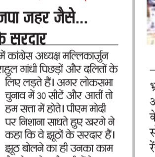
महासम्मेलन में बोले कांग्रेस अध्यक्ष खरगे

जनसभा को संबोधित करते हुए, राहुल ओबीसी युवाओं से अपनी ताकत पहचानने का भी आग्रह किया। उन्होंने कहा कि ओबीसी युवाओं से मेरी सबसे बड़ी शिकायत यह है कि वे अपनी ताकत नहीं समझते। एक बार जब वे अपनी ताकत समझ जाएंगे, तो पूरा परिदृश्य बदल जाएगा।