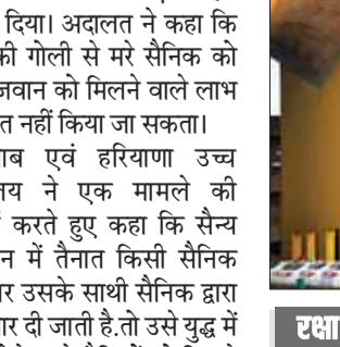
पेंशन देने का दिया निर्देश

पंजाब एवं हरियाणा उच्च न्यायालय ने कहा-उसे वंचित नहीं कर सकते