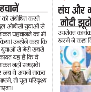
युवा अपनी ताकत को पहचानें

पीएम मोदी में कोई दम नहीं मीडिया ने गुब्बारा बनाया राहुल ने प्रधानमंत्री नरेंद्र मोदी पर तीखा हमला बोला। उन्होंने दावा किया कि वह प्रधानमंत्री मोदी से कई बार मिल चुके हैं और उनमें कोई दम नहीं है। पीएम मोदी कोई बड़ी समस्या नहीं हैं। मीडिया वालों ने सिर्फ गुब्बारा बना रखा है।