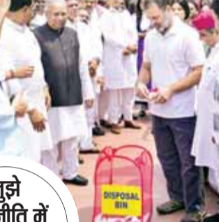
मुझे राजनीति में आए 21 साल हो गए

लोकसभा में विपक्ष के नेता और कांग्रेस के सांसद राहुल गांधी ने शुक्रवार को एक बार फिर ओबीसी के मुद्दे पर खुलकर बात की। राहुल ने दिल्ली के तालकटोरा स्टेडियम में आयोजित 'भागीदारी न्याय सम्मेलन' में एससी-एसटी, ओबीसी वर्ग के मुद्दों पर दमदार ढंग से उठाया। 'भागीदारी न्याय सम्मेलन' में कांग्रेस के राष्ट्रीय अध्यक्ष मल्लिकार्जुन खरगे, कांग्रेस संगठन के तमाम आला पदाधिकारी मौजूद रहे। राहुल ने कहा कि मुझे राजनीति में आए 21 साल हो गए हैं और इस दौरान मैंने जमीन अधिग्रहण बिल, मनरेगा, भोजन का अधिकार और ट्राइबल बिल की लड़ाई लड़ी लेकिन मुझे कहीं कुछ कमी रह गई। राहुल ने कहा कि कांग्रेस और मेरे काम में एक कमी रह गई। मुझे ओबीसी वर्ग की जिस तरह से रक्षा करनी थी, मैंने नहीं की। इसका कारण था कि मुझे ओबीसी के मुद्दे उस वक्त गहराई से नहीं समझ आते थे। 10-15 साल पहले दलितों-आदिवासियों के सामने जो कठिनाइयां थीं, वो मुझे अच्छी तरह समझ आ गई थीं।